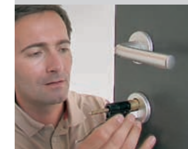
Eenvoudige montage: de gewone mechanische profielcilinder wordt door de elektronische vervangen en het toetsentableau wordt aan de deur of in de omgeving bevestigd.