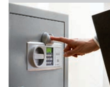
De technologie van het TSE Fingerscan is een eigen ontwikkeling van BURG-WÄCHTER en wordt ook bij kluisen gebruikt.