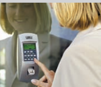
De geheime code voor iedere situatie. U kunt het deurslot ook met een geheime cijfercode openen.