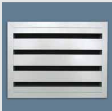
468AK/1 – vooraanzicht