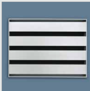
468AK/1 – achteraanzicht